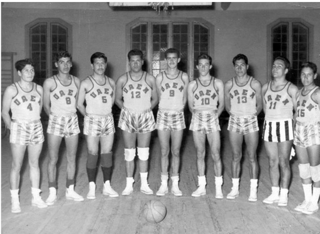
SELECCIÓN UNIVERSITARIA DE BASQUETBOL 1957 - 1958