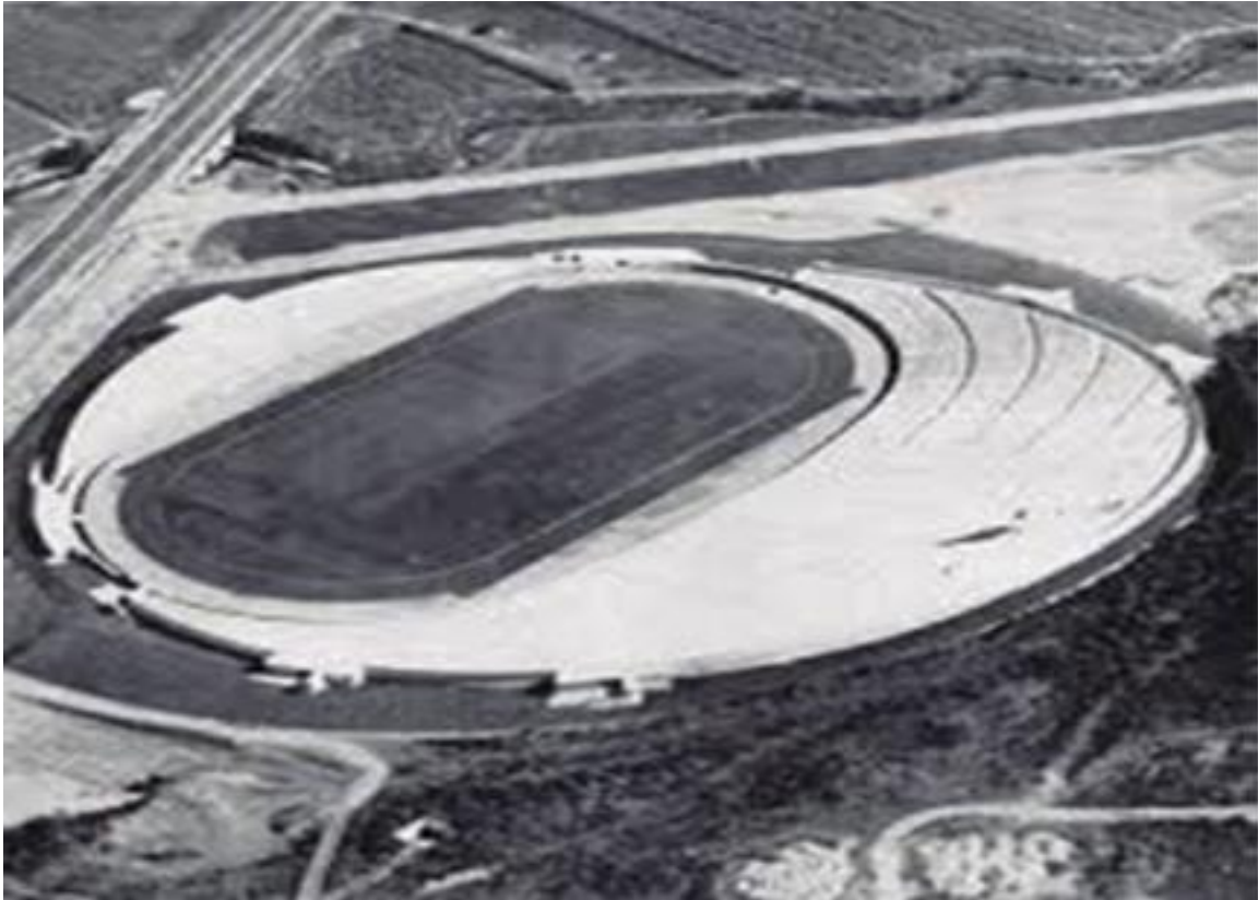
ESTADIO CASI TERMINADO, TERRENOS AUN NO DONADOS A LA U.A.E.M.